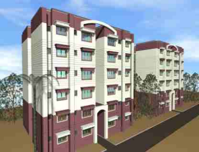
தோராய விலை ரூ. 14.25 to 15.00 இலட்சம் (அனைத்தும் உட்பட)

காவல் துணைக்கண்காணிப்பாளர் / கோட்ட அலுவலர் / சிறை அலுவலர் வீடுகளின் கட்டிடப் பரப்பளவு - 1100 சதுர அடி (3 படுக்கை அறை மற்றும் பால்கனி வசதி)