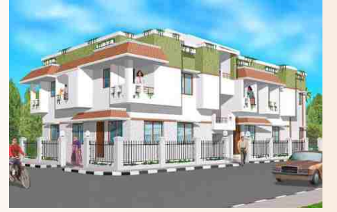
தோராய விலை ரூ. 24.50 to 26.00 இலட்சம் (அனைத்தும் உட்பட)