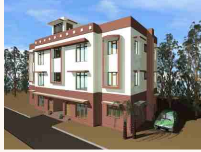
தோராய விலை ரூ. 18.25 to 19.25 இலட்சம் (அனைத்தும் உட்பட)